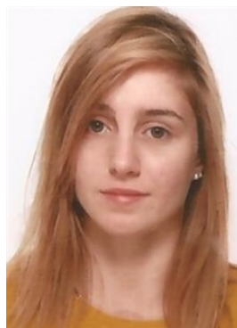
Seljmani Vlora Architecture, 2018-2019, Bachelor semestre 4