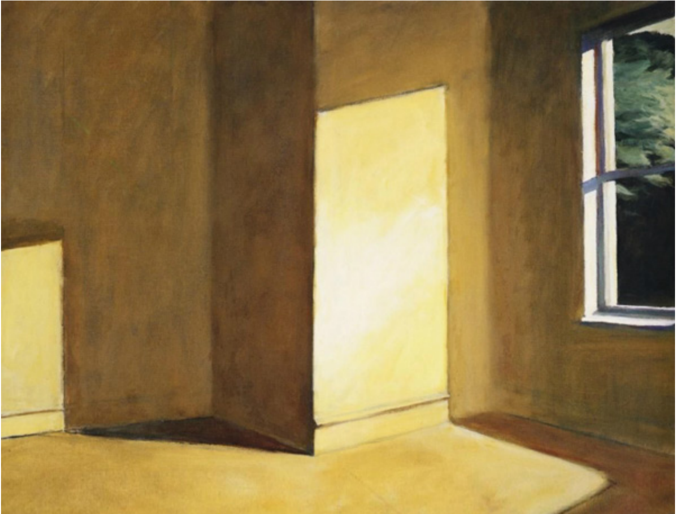
Sun in the empty room 1963 73 × 100 cm Huile sur toile Collection particulière.

Œuvre graphique d'Edward Hopper (1882-1967).