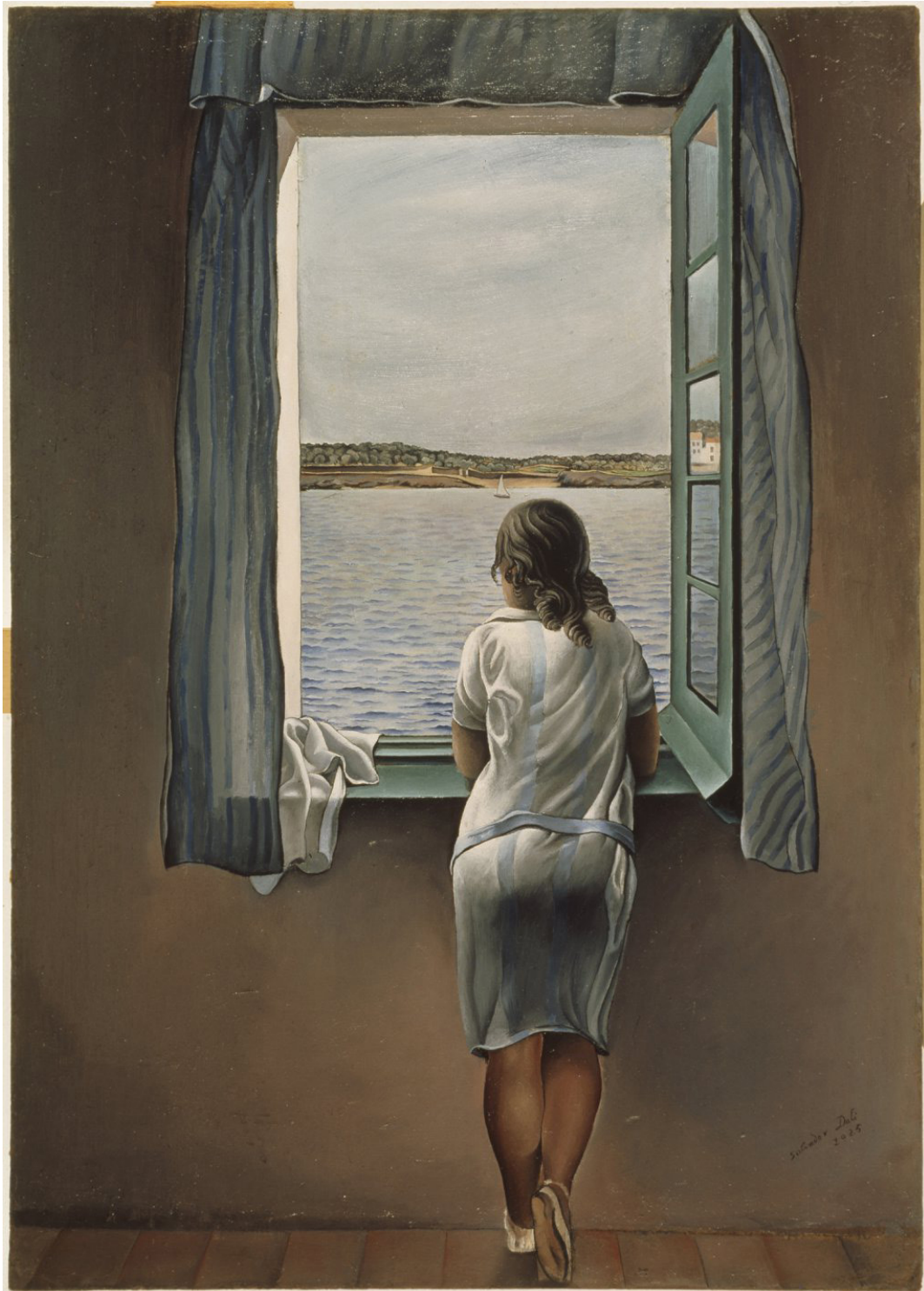
Figura en una finestra 1925 105 x 74,5 cm Huile sur toile MEAC, Madrid.

Œuvre graphique de Salvador Dalí (1904-1989), peintre, sculpteur, graveur, scénariste et écrivain catalan de nationalité espagnole.