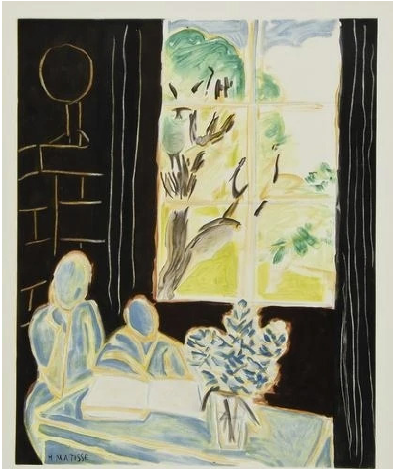
Le silence habité des maisons huile sur toile 1947 61 x 51 cm Collection privée

Œuvre graphique d'Henri Matisse (1869 - 1954) peintre, dessinateur, graveur et sculpteur français.